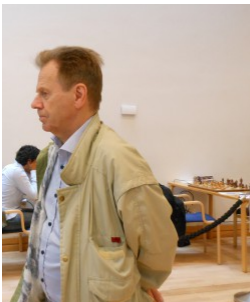
Ulf Andersson besöker Visma Chess Tournament 2014.

Den mest meriterande svenske schackspelaren genom tiderna, Ulf Andersson, kommer att delta i årets Malmö Open. En överraskande och mycket uppskattad start!