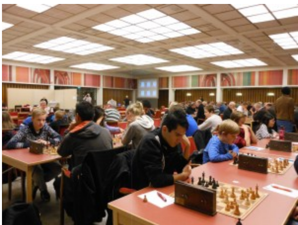
En vy ifrån Rådhushallen 2013.

Kort sagt, allt ser väldigt lovande ut inför årets turnering. Försök gärna locka med er fler deltagare bland era schackvänner. Rådhushallen har plats för fler deltagare.