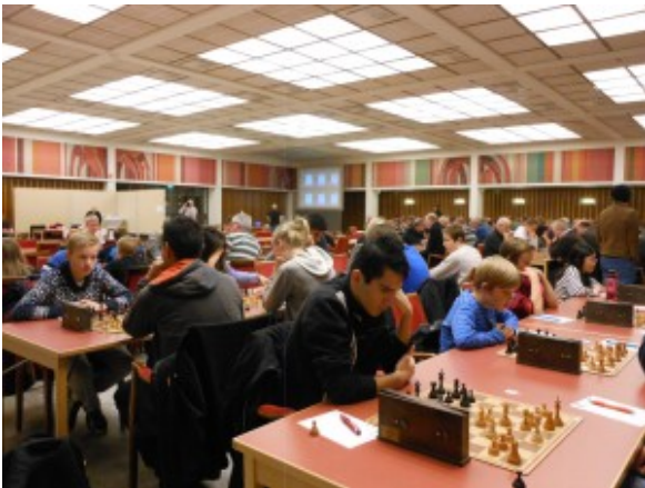
En vy ifrån Rådhushallen 2013.

Kort sagt, allt ser väldigt lovande ut inför årets turnering. Försök gärna locka med er fler deltagare bland era schackvänner. Rådhushallen har plats för fler deltagare.