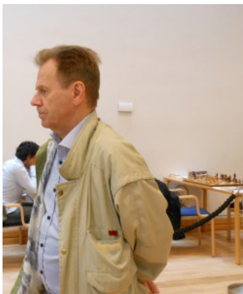
Ulf Andersson besöker Visma Chess Tournament 2014.

Den mest meriterande svenske schackspelaren genom tiderna,Ulf Andersson, kommer att deltaga i årets Malmö Open. En överraskande och mycket uppskattad start!